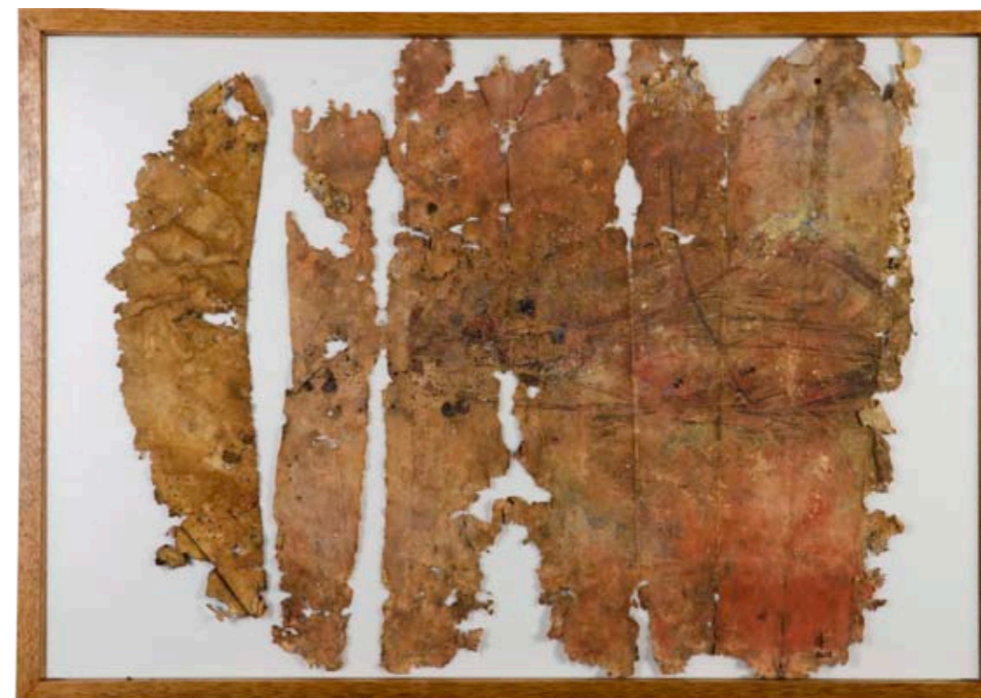
Asas, 68 x 98 cm, 2011 Pergaminho, 81 x 97 cm, 2011