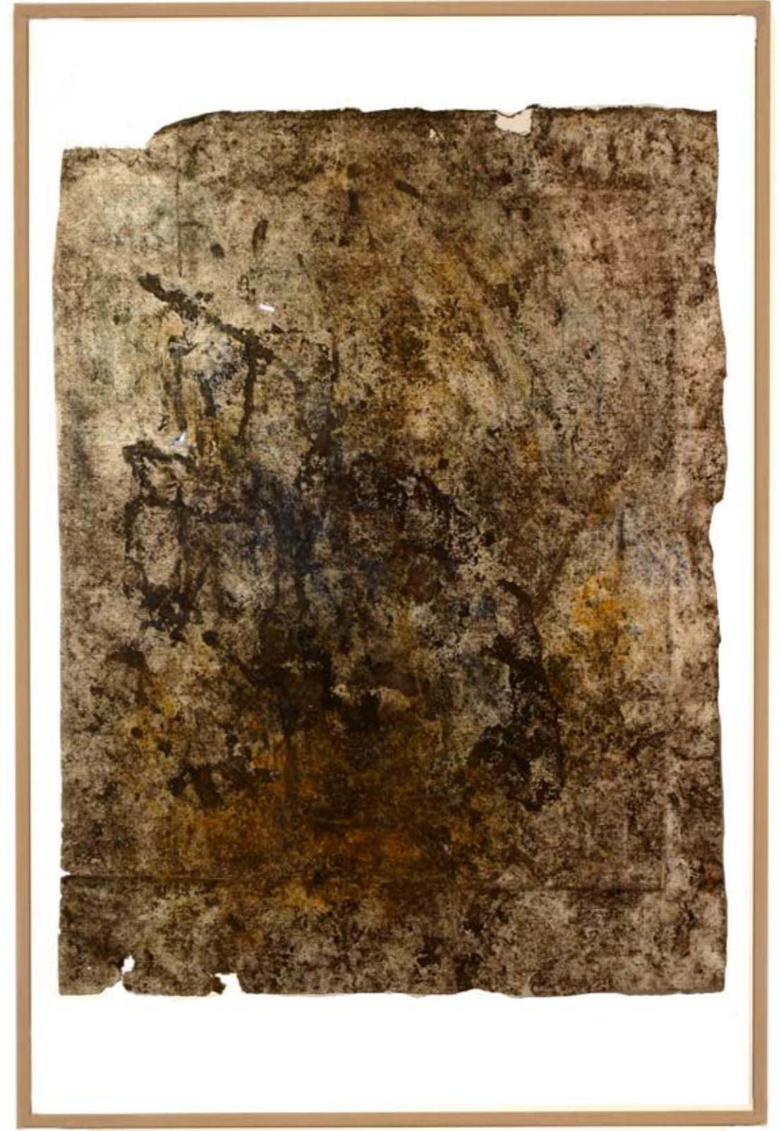
Santiago de Compostela, 122 x 99 cm, 2008