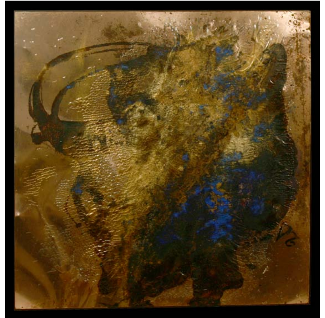
Santiago de Compostela, 88.5 x 88.5 cm, 2008