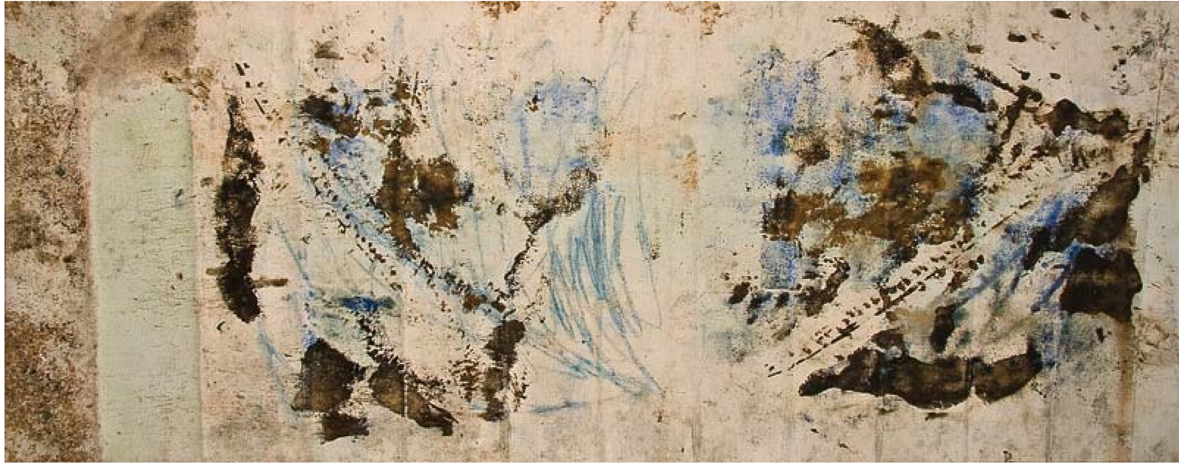
Monte de Gozo, 80 x 200 cm, 2008