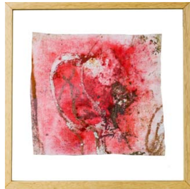
Primavera 19, 48.5 x 48.5 cm, 2008