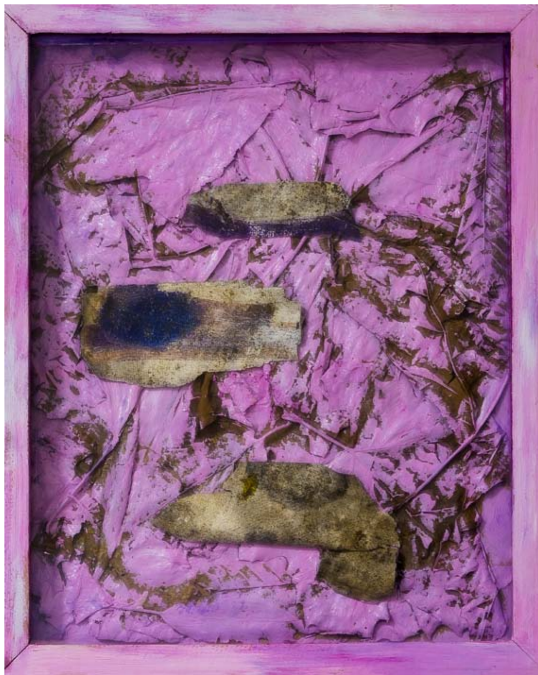
Fragmento do Primavera, 32 x 26 cm, 2004