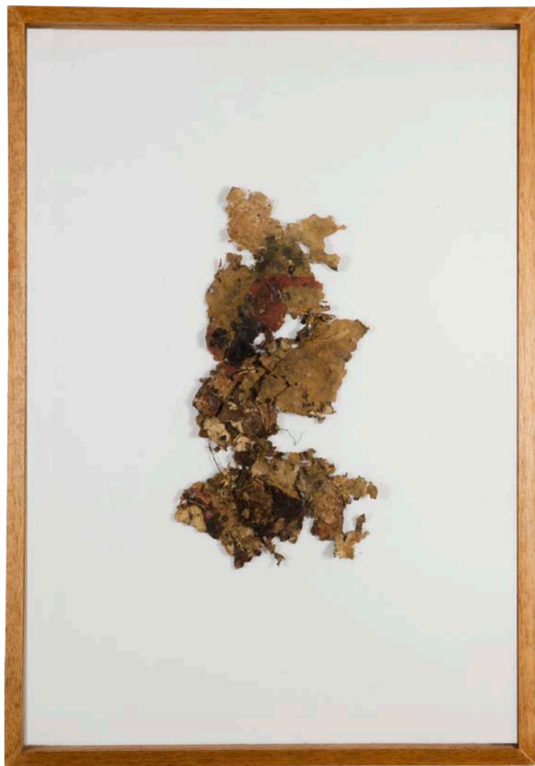
Ilha, 98 x 68 cm, 2011