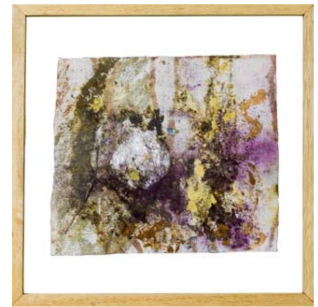
Primavera 23, 48.5 x 48.5 cm, 2008