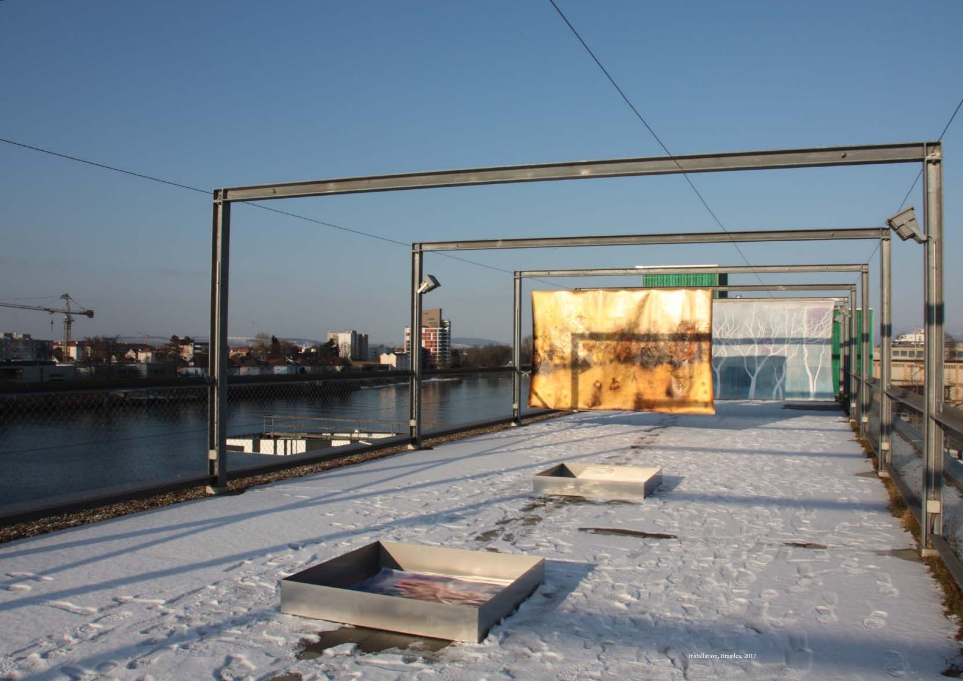
Installation, Brasilia, 2017