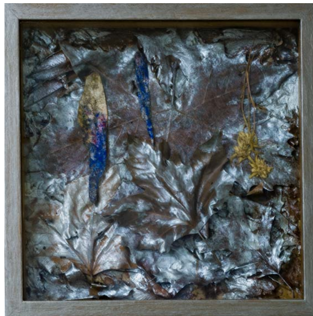
Fragmento do Inverno, 36 x 36 cm, 2004