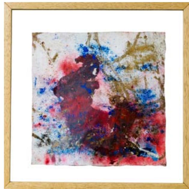
Primavera 16, 48.5 x 48.5 cm, 2008