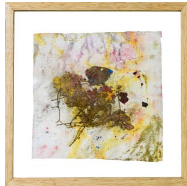
Primavera 20, 48.5 x 48.5 cm, 2008