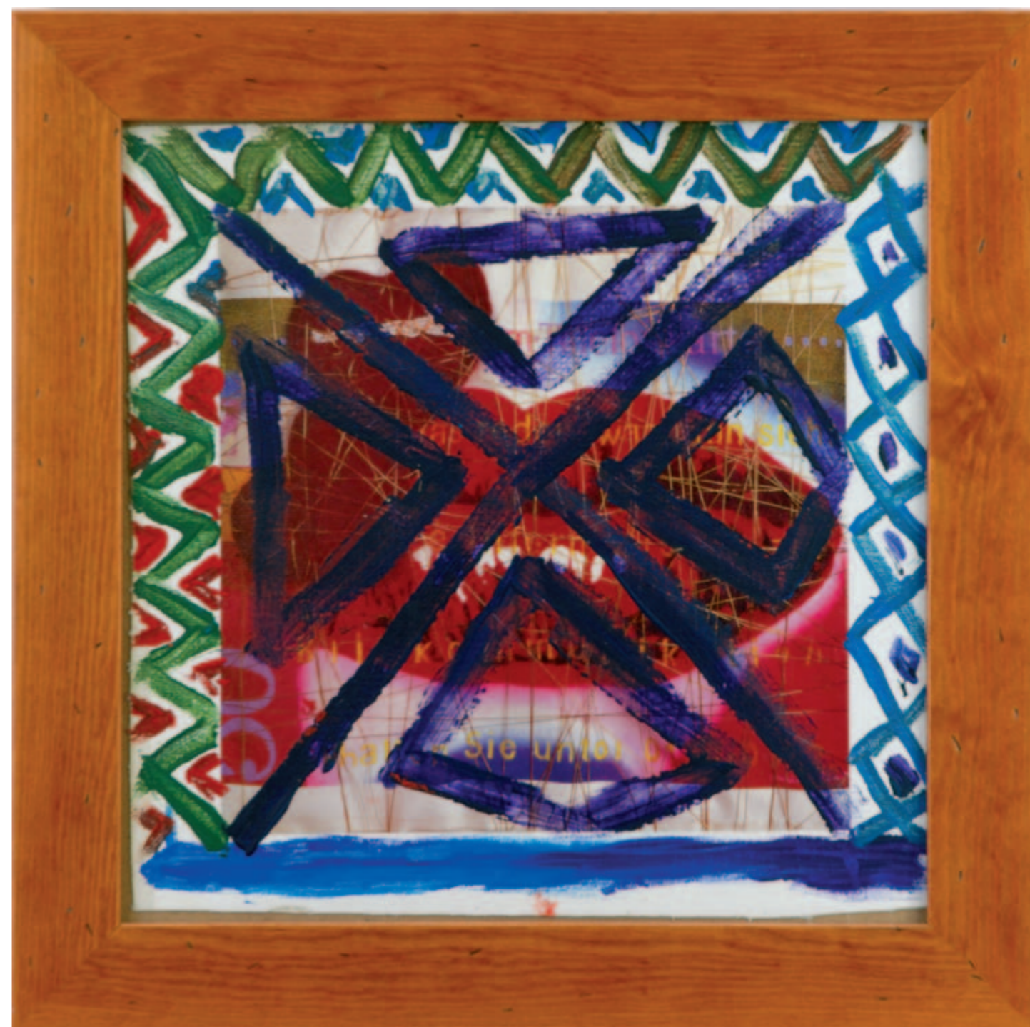
Katuquinas II, 38 x 38 cm, 2006 Katuquinas III, 38 x 38 cm, 2006