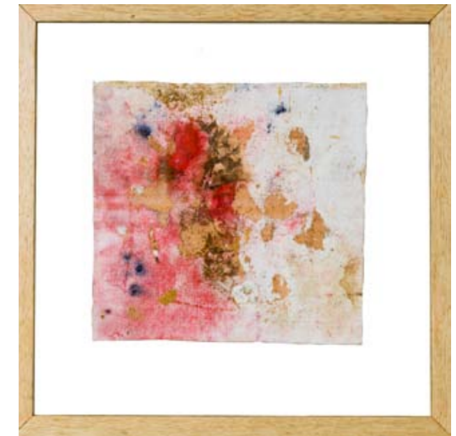
Primavera 4, 48.5 x 48.5 cm, 2008 Primavera 3, 48.5 x 48.5 cm, 2008