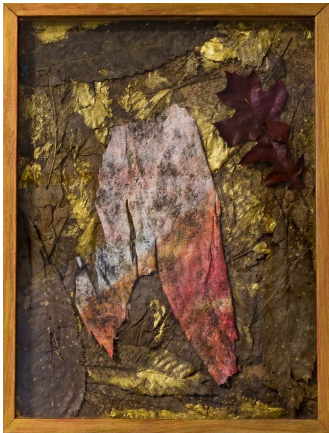
Fragmento do Outono, 42 x 32 cm, 2004