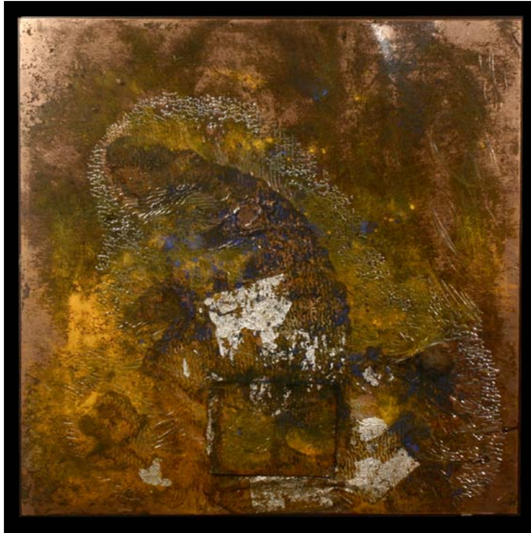
Monte de Gozo, 88.5 x 88.5 cm, 2008