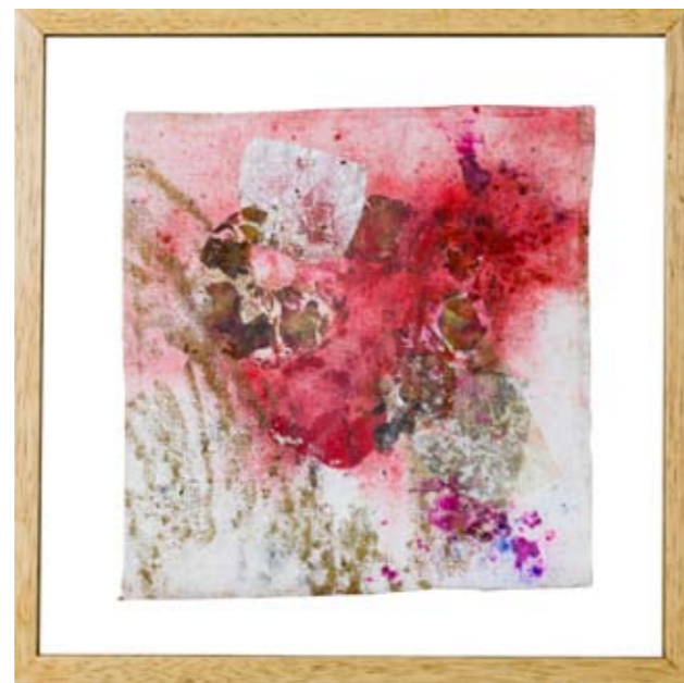
Primavera 17, 48.5 x 48.5 cm, 2008