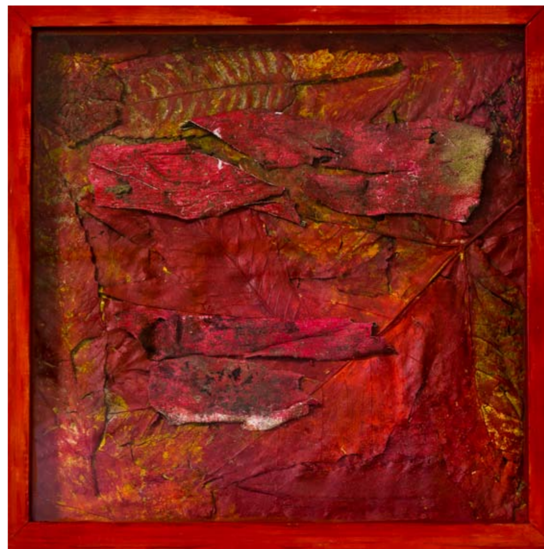
Fragmento do Verão, 32 x 32 cm, 2004