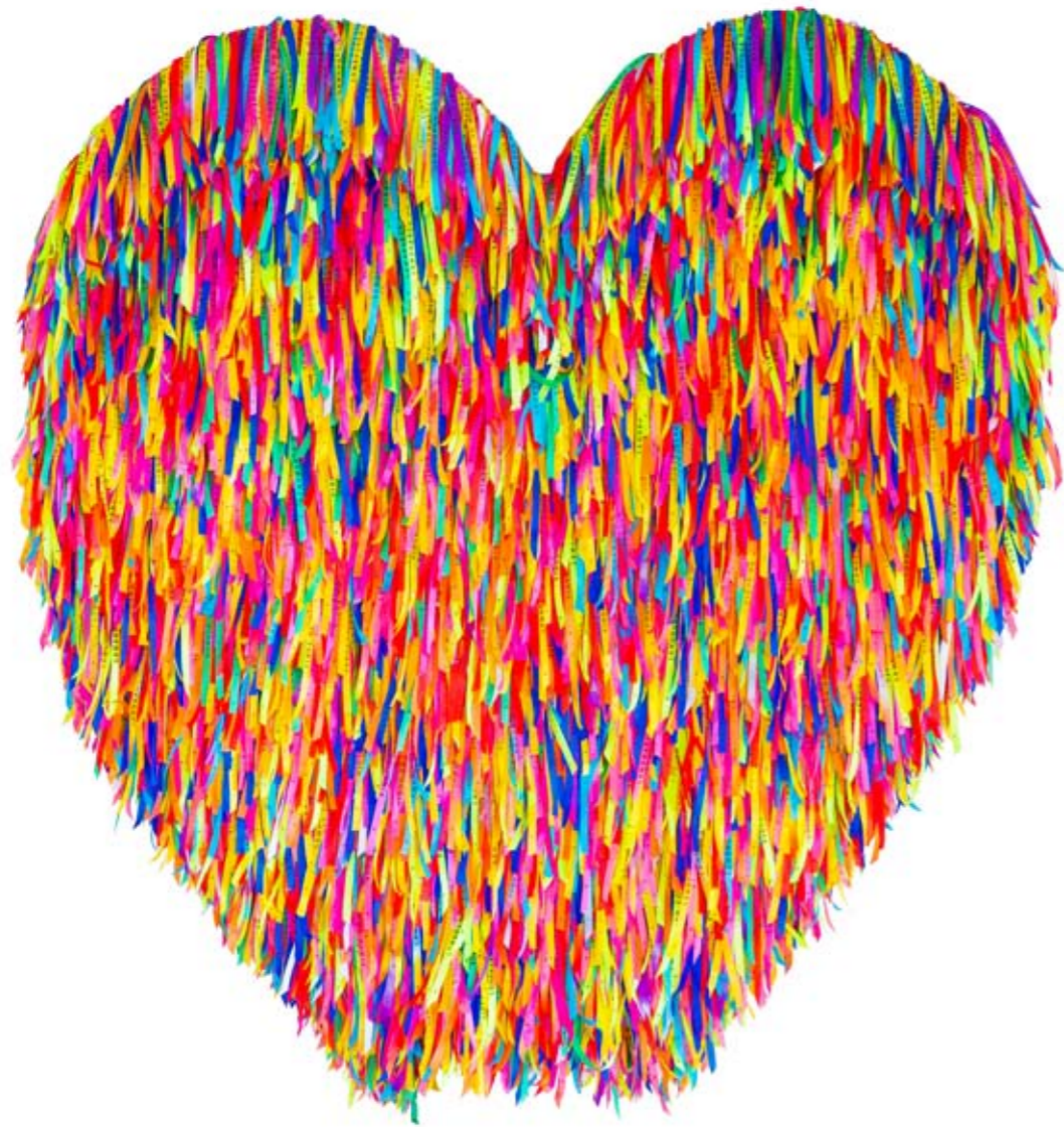
Coração Bahia, frontside, 145 x 125 cm, 2016