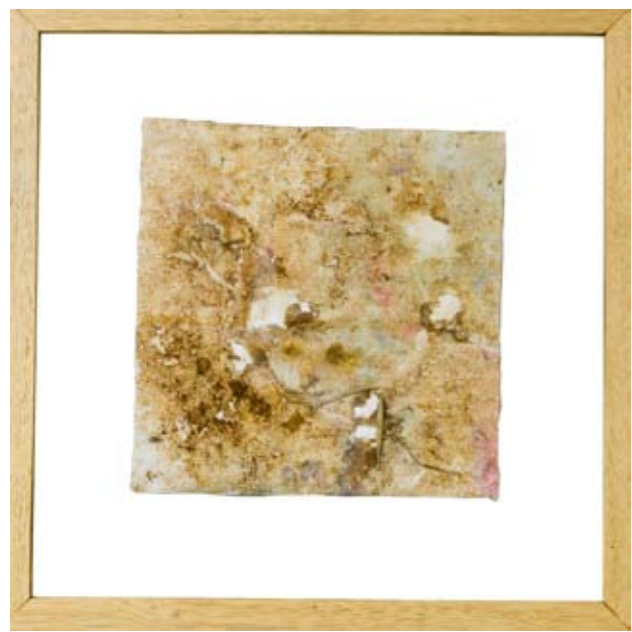
Primavera 14, 48.5 x 48.5 cm, 2008