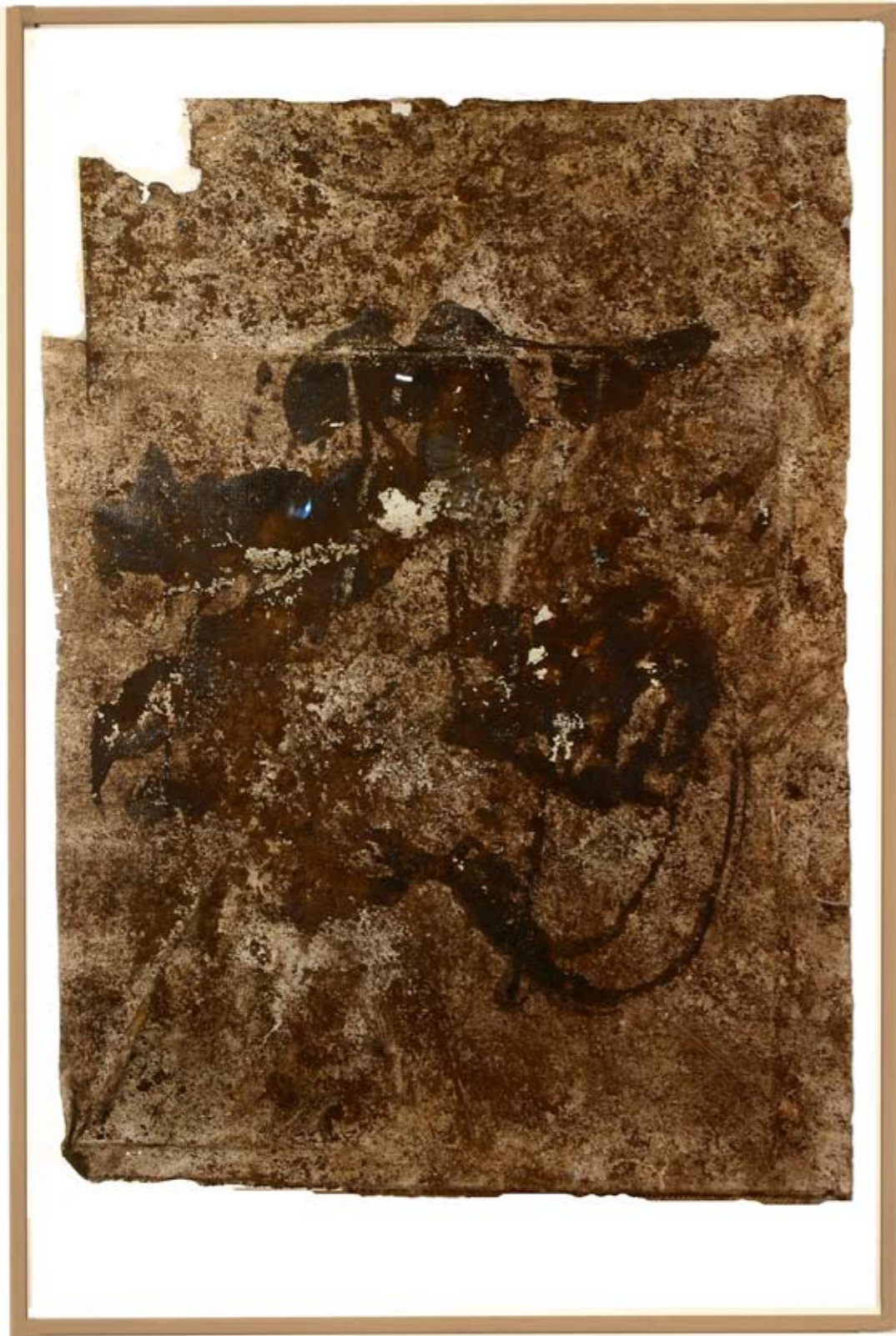
Monte de Gozo, 122 x 99 cm, 2008